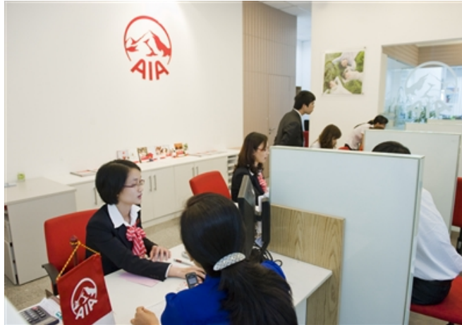
Trung tâm phục vụ khách hàng của AIA.

Công ty TNHH Bảo hiểm Nhân thọ AIA (Việt Nam) vừa nhận Bằng khen của UBND TP Hà Nội ghi nhận những thành tích và đóng góp của Cty đối với phong trào thi đua, xây dựng và phát triển doanh nghiệp của Thủ đô. Đây cũng là năm thứ 3 liên tiếp AIA Việt Nam được đón nhận vinh dự này.