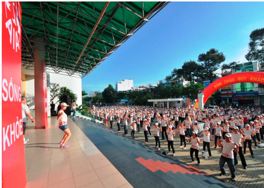
AIA Việt Nam với chương trình sống khỏe

Công ty TNHH Bảo hiểm Nhân thọ AIA (Việt Nam) vừa được đón nhận Bằng khen của UBND Thành phố Hà Nội ghi nhận những thành tích và đóng góp của Công ty đối với phong trào thi đua, xây dựng và phát triển doanh nghiệp của Thủ đô.